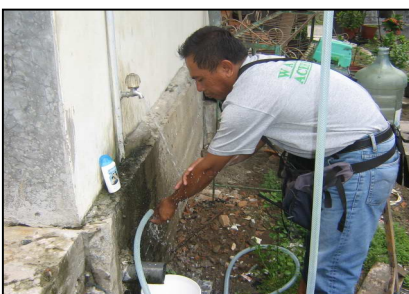
Sasai mbotomö, sasai danga fake sabu na no awai wamofa sita'unö