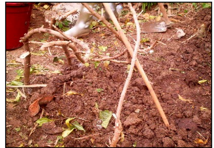
Tögi sino muduhö ena'o göli (pagar)