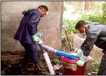
Mufofa sita'unö moroi bakha ba tögi WC/guda WC