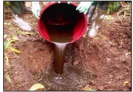
Tibo'ö tambu sita'unö bakha ba dögi sino mukhao