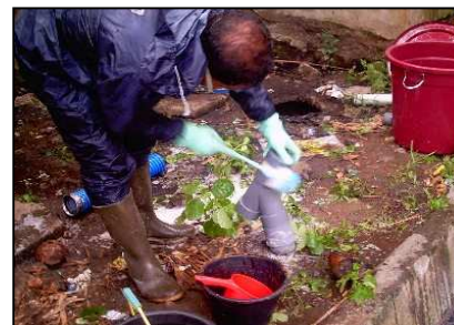
Fefu fakake fofa, musasai fake sabu bahegöi nukha sino mufake