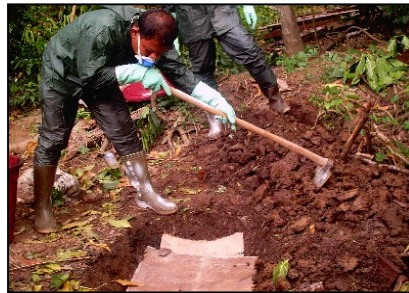
Duhö mangawuli tögi faoma tambu nikhao