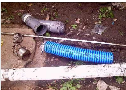
Efasi/heta fofa moroi banawönia