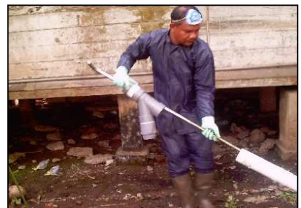
Fasa mangawuli fakake fofa, be'e wanikha faböi howutö ba iro'ö banahia nia