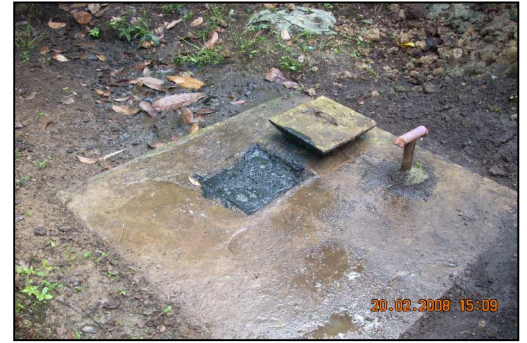
Gambar septic tank penuh