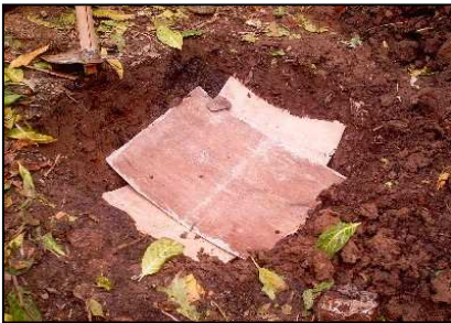
Balugö sita'unö sino mube'e ba dögi faoma fafa/lewuö/geu