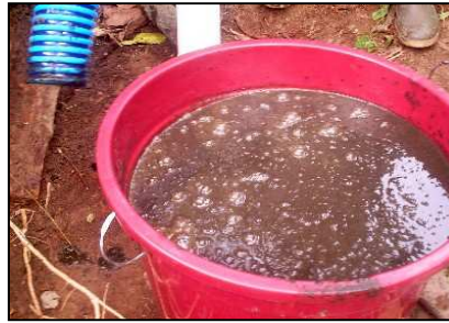
Tambu sita'unö labe'e nahia sino so (dimba)